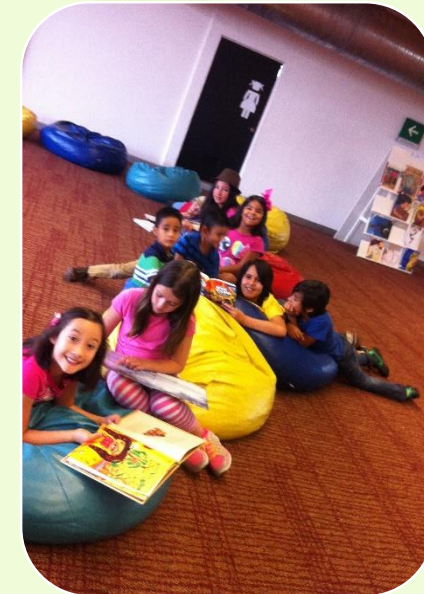
Cursos y talleres externos