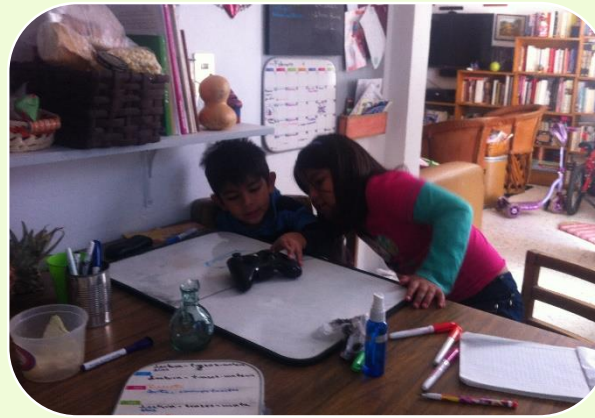
Aprendizaje basado en problemas