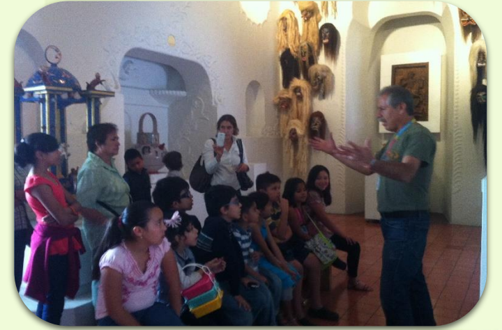
Trabajo de campo