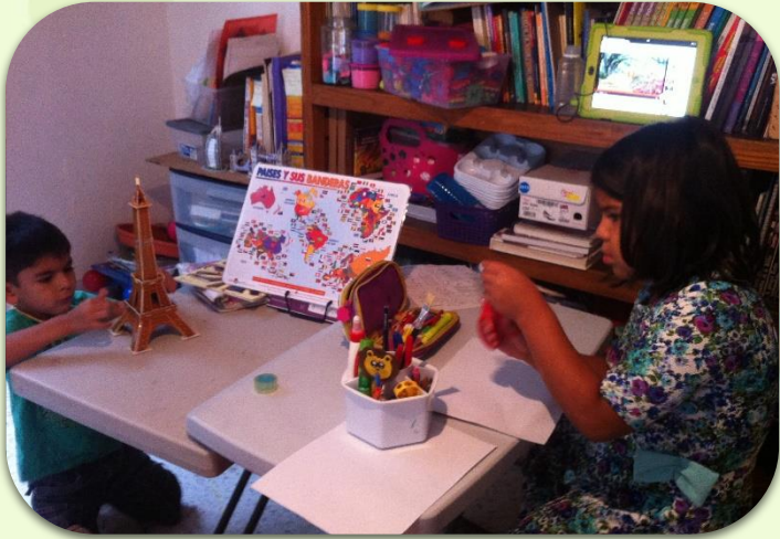
Ambientes de aprendizaje